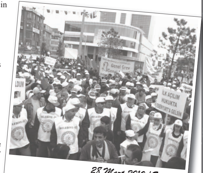
28 Mart 2010 / Esenyurt