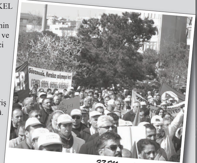
27 Mart 2010 / Kartal