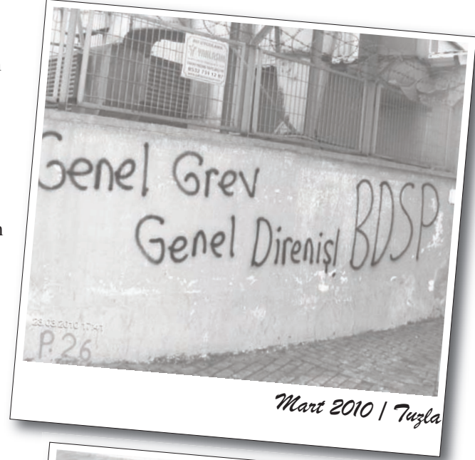
Mart 2010 | Tuzla

1 Nisan, 1 Mayıs ve 26 Mayıs süreçlerini örnek için hazırlıklara başlayan Esenyurt BDSP, bu süreçlerin tartışıldığı ve hazırlık sürecinin